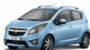
Светло-серый металл Misty Lake