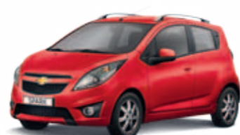
Красный Super Red