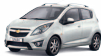
Серебристый металл Switchblade Silver