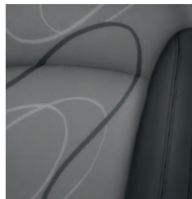
LT – темно-серая ткань с серебристыми вставками