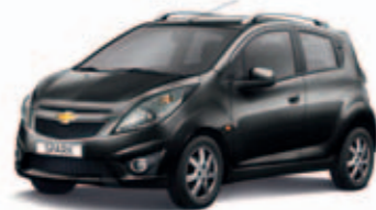
Черный металл Carbon Flash Black