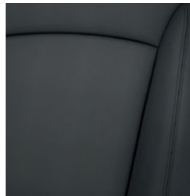
Base и LS – темно-серая ткань