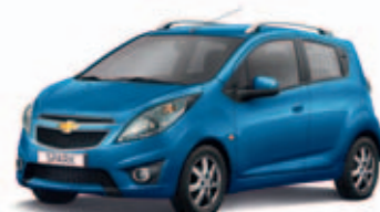
Синий металл Moroccan Blue