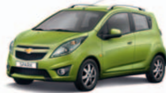
Салатовый металл Coctail Green